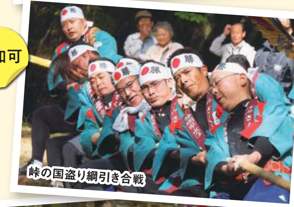
峠の国盗り綱引き合戦