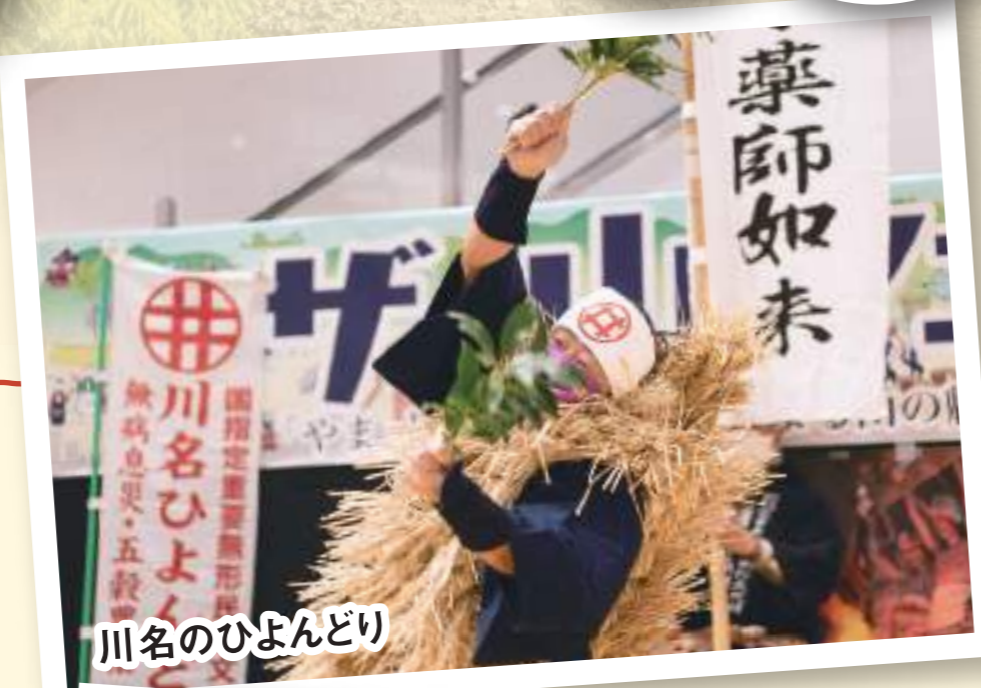
川名のひよんどり

お堂の入り口に立つ若者たちと大たいまつ の揉み合いが勇壮な伝統芸能。引佐町川名で 約600年前から続く舞の一場面が見られます!