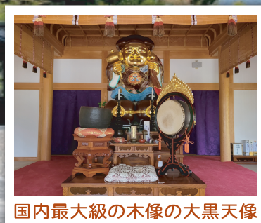
国内最大級の木像の大黒天像